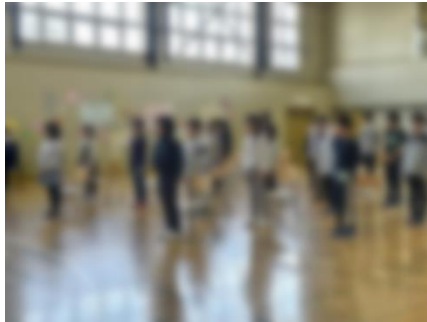
校歌や歓迎の歌を元気に歌います。