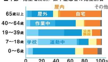
■年齢・発生場所別／熱中症患者の発生割合