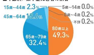
■年齢別／熱中症死亡者の割合