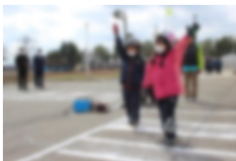
【横断歩道の渡り方を学ぶ新1年生】

指導にあたってくださった士幌駐在所の方からは「今日学んだことを忘れずにこれからも交通安全に気をつけて」とお話がありました。交通安全指導員のみなさん、そして、午前中に自転車の点検をしていただいたキング商会様、ありがとうございました。