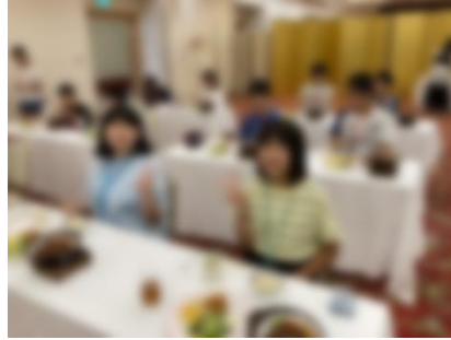
宿泊先の食事風景②