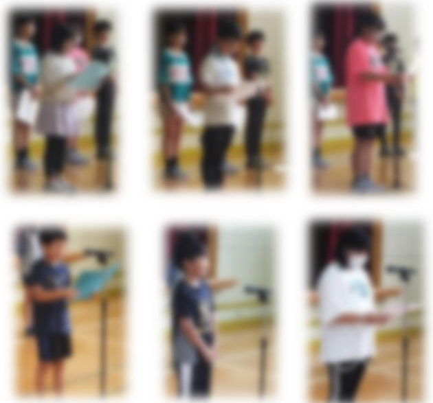
上段/1学期終業式 下段/2学期始業式 ※紙面の都合で学年1名のみ掲載しています。

終業式は奇数学年、始業式は偶数学年の代表が思い出や抱負などを発表してくれました。1学期を通しての学びが見える発表で、子どもたちの成長がよく感じられました。特に高学年の発表が素晴らしく、後輩の良いお手本となっています。(今回発表の機会が無かったお子さんは後期に発表します。)