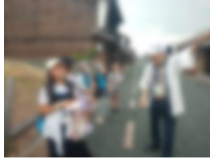
美濃市の町内見学