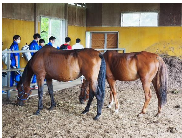
【士幌高校の施設見学の様子】