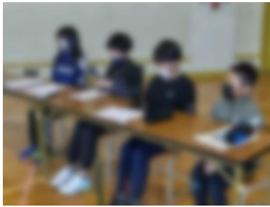
選挙管理 委員の メンバー

2月22日(木)は、後期児童会総会(反省会議)と令和6年度前期児童会役員選挙が行われ、三役・文化委員会・保体委員会の反省報告の後に、質問や意見を受け、それぞれ承認されました。