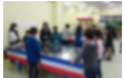
レクリエーション①