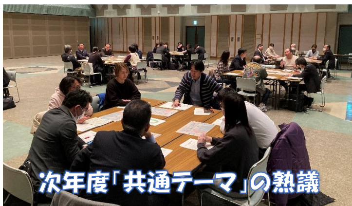
次年度「共通テーマ」の熟議

熟議では「しほろ学」「デジタル、ICT 教育」「夢に向かう」「キャリア教育」「子どもの学び＝大人の学び」などといった意見が出されました。“単発”“イベント”にとどまらない、持続可能な取組を模索する熟議となりました。これらの意見をもとに、4月中に“連携会議”を行い、令和6年度の「共通テーマ」を確定させる予定です。その後、各学校(園)で運営協議会を開いていただき令和6年度の活動がスタートしていきます。