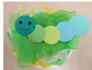
「キャベツとあおむし」