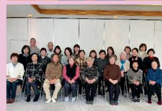
北中ふれあいサロン