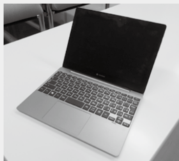
実際に使用しているタブレット

令和8年より議会や委員会等でタブレットの試験導入を開始いたしました。タブレットの本格的な導入に向けて、総務文教常任委員会を中心に協議等進めていきます。