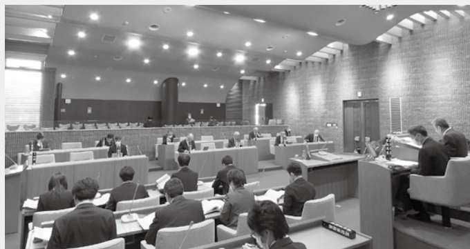
予算審査特別委員会で使用している様子