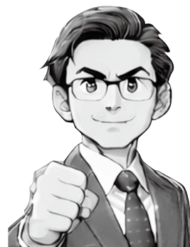
伊藤 健蔵 議員