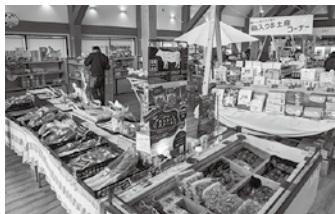
↑ピア21しほろ内装(リニューアル後)

答 業務用冷凍庫については、一部家電リサイクル法の対象外になる製品がある。町では、一般廃棄物処理として収集していかないが、搬出等について、後日、役場だより等でお知らせする予定。買い替えの場合は、購入する小売業者に相談してほしい。不明な点があれば、町民課生活環境係(☎52331)に問い合わせしてほしい。