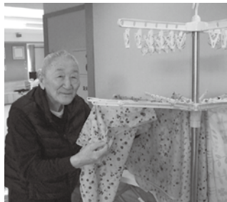
↑洗濯物を干していただいている様子

「私に何かできることはないかしら？」と利用者様からお声がけいただくこともあり、身体状況に合わせて無理のない範囲で、【できること】【得意なこと】を職員と共に取り組んでおります。利用者様の笑顔や、達成感・充実感に満ちた表情を拝見できることが、私たちにとっても大きな喜びです。