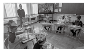
【しほろ牛を使ったふるさと給食】