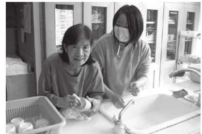
↑コップを洗っていただいています。

当施設では家庭的な雰囲気の中、日常生活に必要な家事も行っていただいています。洗濯物を畳んで棚にしまう、季節に合わせて衣替えをする、感染対策を兼ねて身の回りを拭き掃除するなど、その内容は多岐にわたります。