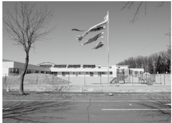
【新園舎で泳ぐこいのぼり】

「こいのぼり」は、新園舎でも子どもたちの日々の「滝登り」を見守り、応援し続けてくれることでしょう。