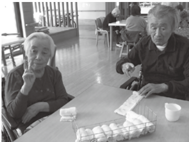
↑毎食使うおしぼりをたたんでいただいている様子