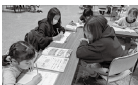
【北大生による学習サポート塾】