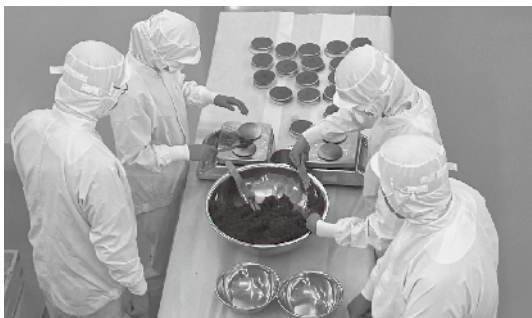
【農産加工 どちらき製造】

1 年生は「総合実習」という授業で、アグリビジネス科・フードシステム科共通で畜産、園芸、作物、乳加工・肉加工・農産課を体験しています。生産の現場から加工の実際までを知るための実習です。初めてのことばかりですが、真剣に取り組んでいます。