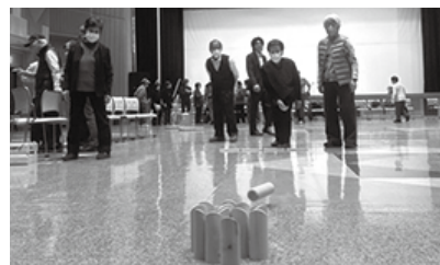
【柏樹学級活動の様子】