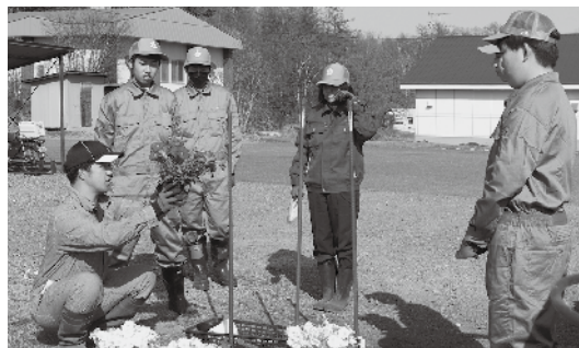
【園芸 玄関前花壇定植】