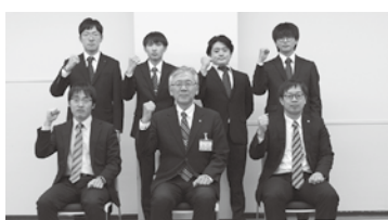
「しほろ農業塾」開講式