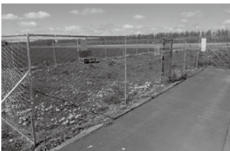
ピア21しほろ ↓新ドッグラン