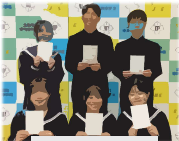
認証状を手にする書記局メンバー