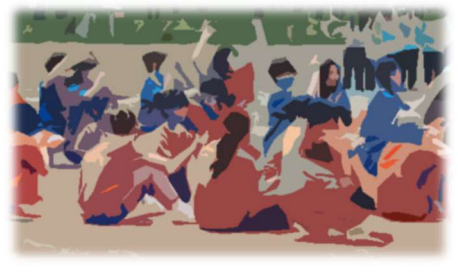
総練習の様子から