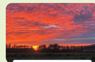
真っ赤すぎる夕焼け。少し怖いくらいだった。