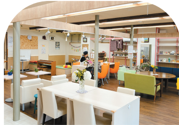
室内は広々として明るく、リラックスできる。 ドリンクが用意されているのもうれしい。