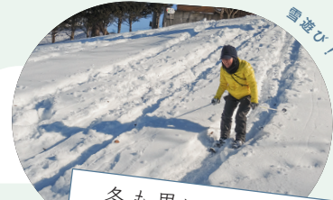
冬も思いっきり遊ぶ

定年退職を機に移住を決意。 十勝を選んだ決め手は、エゾリス・モモンガ・ナキウサギなどの可愛い野生動物にたくさん出合える自然環境と冬の十勝晴れだそう。