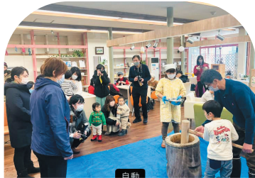
マルシェやイベントを通して、 子どもから大人まで幅広い年齢の町民が交流。