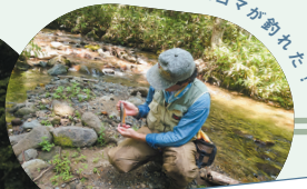
キャンプ場で車中泊

散歩途中に見つけた家の近くの斜面を利用してミニスキー。冬の景色やアクティビティも楽しみの一つです。