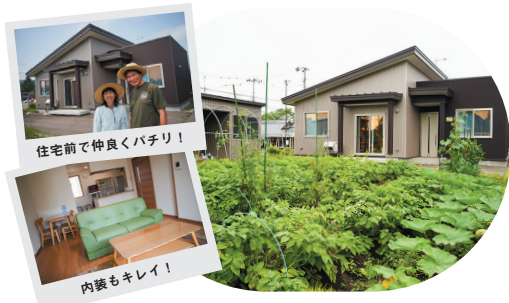
住宅前で仲良くパチリ！

2018年に完成した「土幌町農園付き住宅」。全4棟で各戸100㎡の農園、事務カウンター、書庫付き。テレワークやサテライトオフィスなどのお試しとしても利用可能。