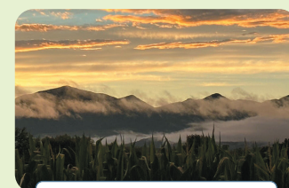
雨上りの日、虹が出た後の夕焼け