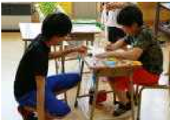
改めて悪邪気な自分ふりかえる □□