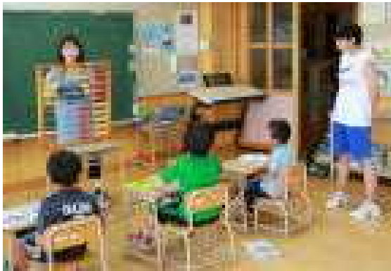
身をもって感じた礼儀の大切さ □□

私からのリクエスト「①今日一日、小学生が『こんな中学生になりたいな』と思えるような姿を見せてください。②最後に、今日の感想を五七五で教えてください。」にも、しっかり応えてくれました。