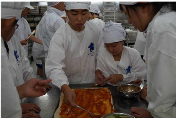
♪ピザソースをたっぷりぬっていきます