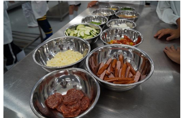
♪ピザにのせる豪華な具がそろっています