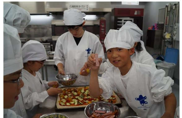
♪豪華な具たちをドンドンのせていきます！