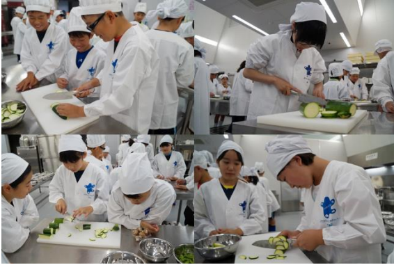
♪真剣な表情や、和やかな雰囲気ですっキーニを切りました