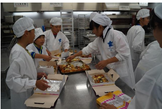
♪しっかり焼いた後に、切り分けたものを、自分の箱に詰めていきます